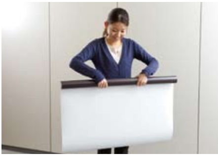
丸まった癖をのばすため反対にまき直します