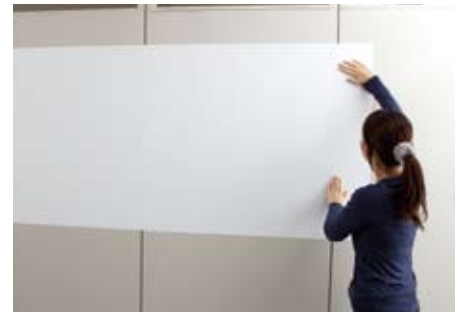
壁面に沿って広げます。