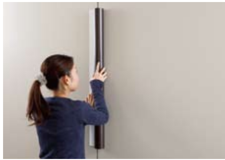
上下を押し延ばしながら固定します