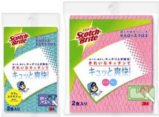
（左）<スコッチ・ブライト>セルローススクラブ クロス （右）<スコッチ・ブライト>セルロース クロス