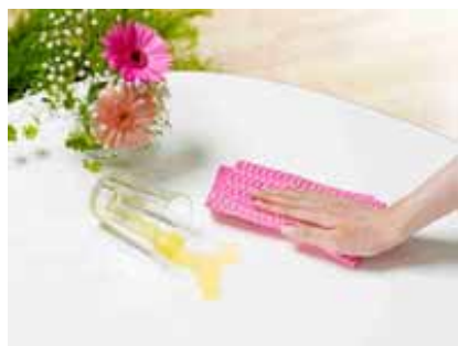
テーブルの拭きとりに