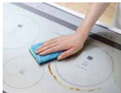
IHのこびりつき汚れに (セルローススクラブ クロス)