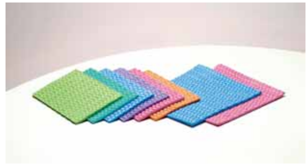
豊富なカラーバリエーション

天然植物せんい素「セルロース」で『新しい拭きとり感』<スコッチ・ブライト>セルローススクラブ クロスは、吸水力が高く乾燥が速い天然植物せんい素「セルロース」を使用し、『新しい拭きとり感』を実現します。