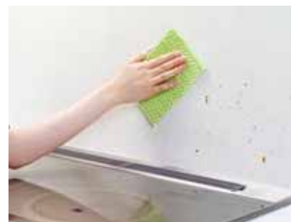
油の飛びハネ汚れに