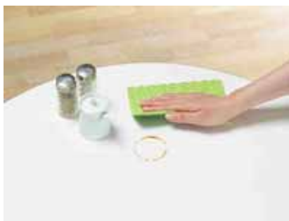
お醤油の輪ジミに