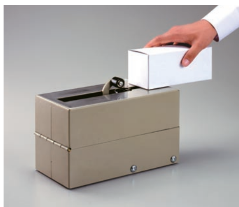
L字貼り専用ディスペンサー S-63