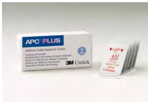
使いやすいプリスター APC™ インベントリー ディスペンシング システムで、管理しやすい包装形態です。