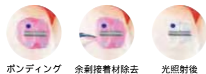
ボンディング 余剰接着材除去 光照射後