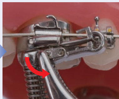
撤去はクリップをはずすだけ