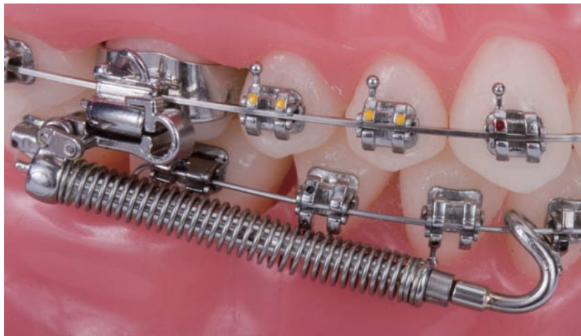
フォーサス™ EZ2 モジュール

＜フォーサス＞ダイレクトプッシュロッド(DPR)シリーズは、テレスコープ式のストレートなスプリングモジュールで持続的な矯正力を発揮します。技工作業が必要ありませんので、採用されている治療システムに追加して即日ご使用いただけます。