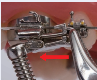
近心からヘッドギアチューブに挿入